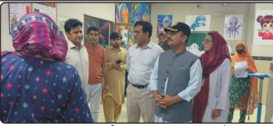
ڈیپٹی مشرف ملک نے ایک گروہ کے ذریعہ کھانا اور دوائی کی تقسیم کی۔