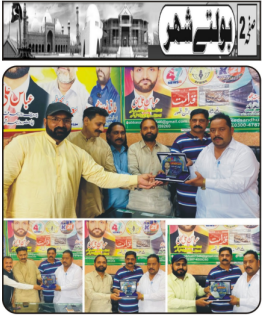
محافظ گلبرگ نے سول سروسز کے لیے 47 نئی جگہوں کی منظوری دے دی ہے۔