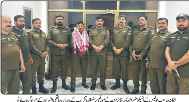
جناب صاحب سیکرٹری سپریم ایف ایف ایف کے ساتھ دیگر افسران اور اہل کاروں کی تصویر

وزیراعظم نے جنرل پرویز مشرف کی رٹائرمنٹ پر افسانہ لکھنے والے نیکو صاحب کو ایف ایف ایف کے سیکرٹری سپریم کے طور پر تعینات کیا ہے۔